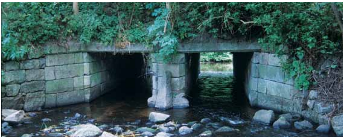
Under den fredede Boltinge Bro på Fyn løber der stadig vand.