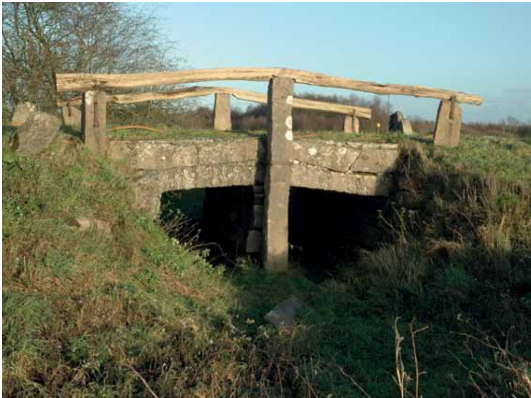
Der løber ikke længere vand under Immervad Bro, idet åen er ledt udenom. Broen er en del af hærvejsforløbet i Sønderjylland.